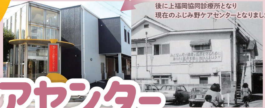
1980年 大井医院福岡分院建物後に上福岡協同診療所となり現在のふじみ野ケアセンターとなりました